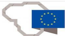
Profesinio mokymo ir suaugusiųjų švietimo sistemos tarptautiškumo