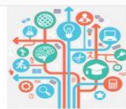
„Epile“ nacionalinė paramos tarnyba (NPT)